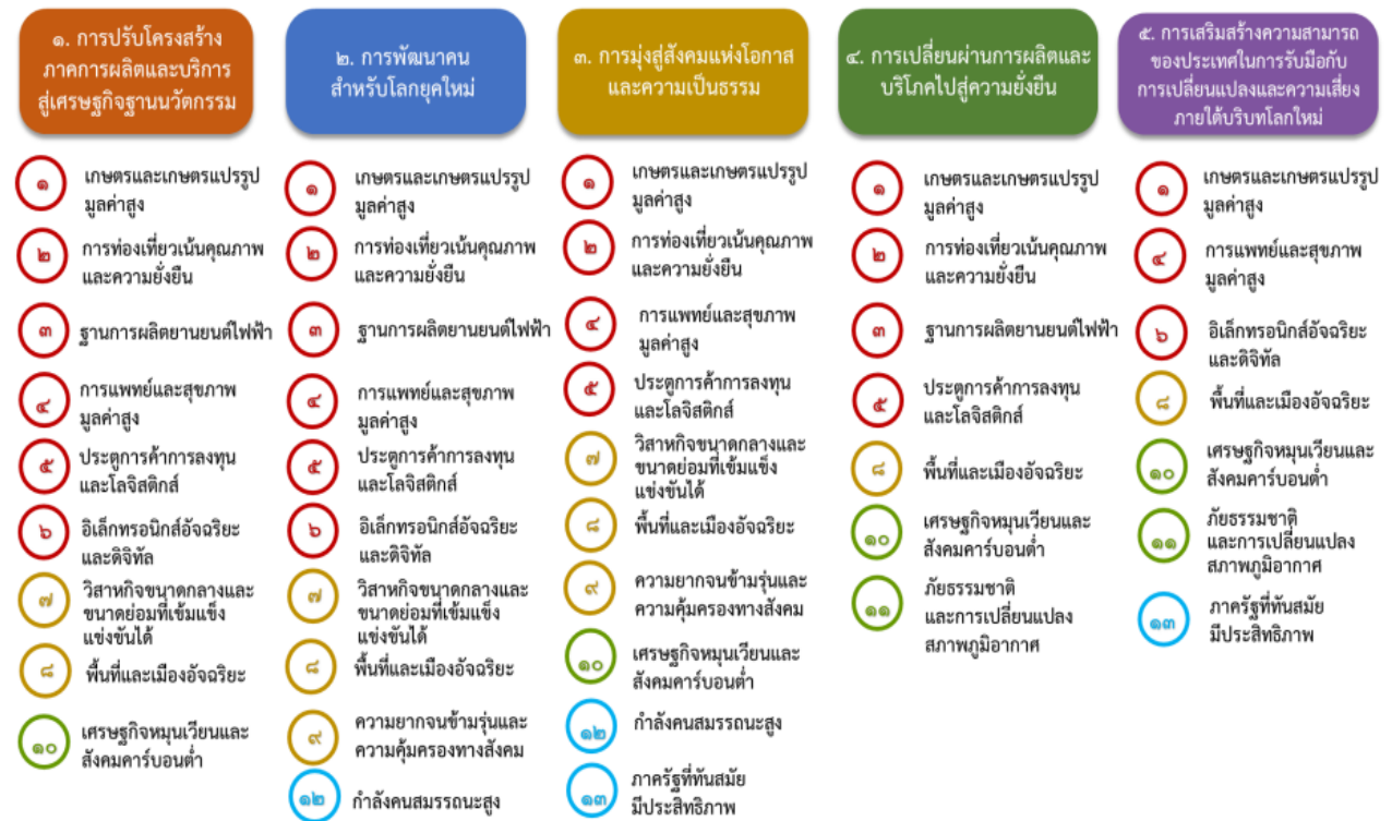
แผนภาพที่ ๓.๑ ความเชื่อมโยงระหว่างหมวดหมู่การพัฒนา กับเป้าหมายหลัก

ความเชื่อมโยงระหว่างหมวดหมู่การพัฒนา กับเป้าหมายหลักแสดงไว้ในแผนภาพที่ ๓.๑ โดยหมวดหมู่การพัฒนาที่กำหนดขึ้นเป็นประเด็นที่มีลักษณะเชิงบูรณาการที่ครอบคลุมการพัฒนาตั้งแต่ในระดับต้นน้ำจนถึงปลายน้ำ และสามารถนำไปสู่ผลพัฒนาทั้งในมิติเศรษฐกิจ สังคม ทรัพยากรธรรมชาติและสิ่งแวดล้อมไปพร้อมๆ กัน ทำให้หมวดหมู่แต่ละประการสามารถสนับสนุนเป้าหมายหลักได้มากกว่าหนึ่งข้อ นอกจากนี้การพัฒนาภายใต้แต่ละหมวดหมู่ไม่ได้แยกขาดจากกัน แต่มีการสนับสนุนหรือเอื้อประโยชน์ซึ่งกันและกัน